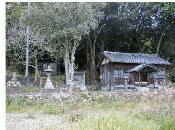
大東社日塔 (大東荒神社)