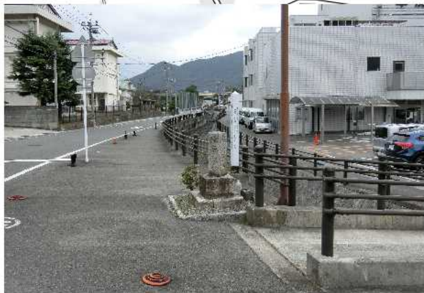
福原社日塔 (備前緑陽高校の西)