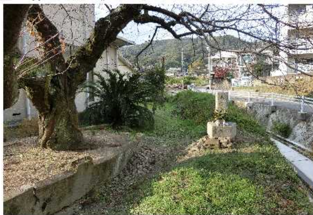
塩谷社日塔 (歴史民族資料館)