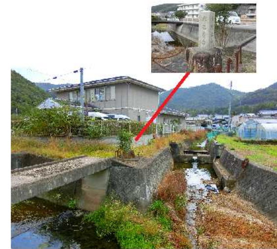
大淵社日塔 (ニチイケアセンター備前)